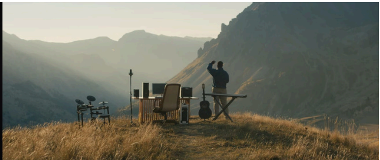
Nouveau Lendemain (Antoine Bouillot) - 2022

→ De 2022 à 2024, une participation à un total de plus de 50 projets dont une trentaine de courts métrages. Egalement aux postes de scripte, cadreur, électricien, assistant monteur, assistant de production, régisseur, décorateur, etc.