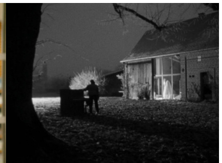
J'en Rêve Encore (Antoine Bouillot) - 2023