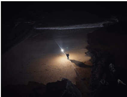
Déjà ? (Mattéo Leroy) - 2023