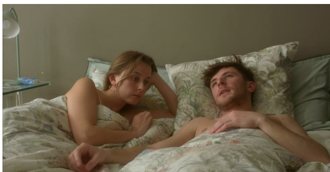
Liaisons discrètes, court métrage 2023