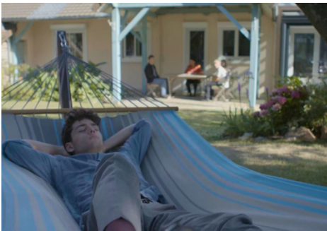
La Boucle Sèche (Victor Lepasant) - 2023

→ Une dizaine de projets en tant que monteur, dont 5 courts métrages (en voici un échantillon)