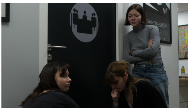
On verra ça en post-prod, documentaire en cours