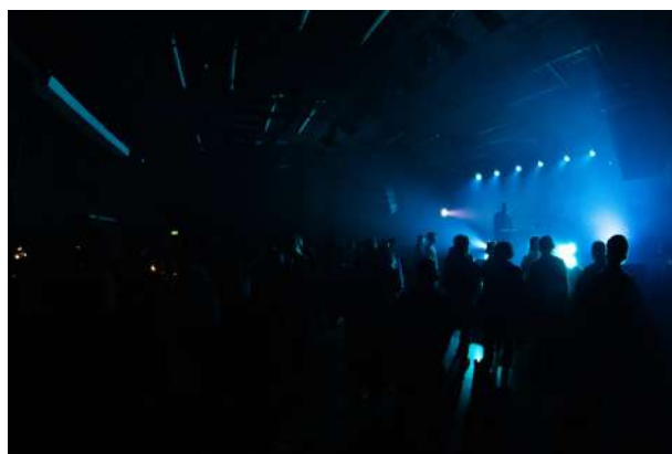
Salle de concert à La place Hip-hop à Châtelet.