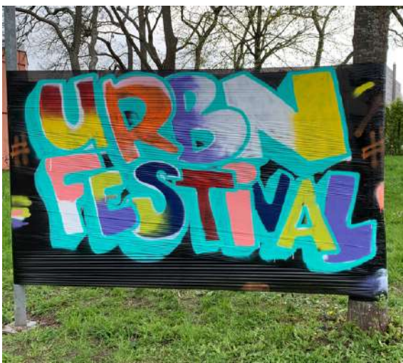
Oeuvre réalisée par les étudiants de l'université Sorbonne Paris Nord lors des ateliers URBN WORKSHOPS Graffiti