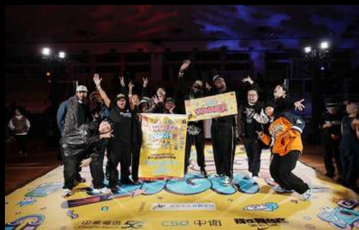
Les étudiants français sur la scène de College High 2023 remportant la victoire