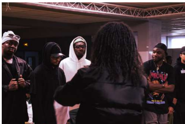
Ouverture des portes et accueil des participants au Battle.