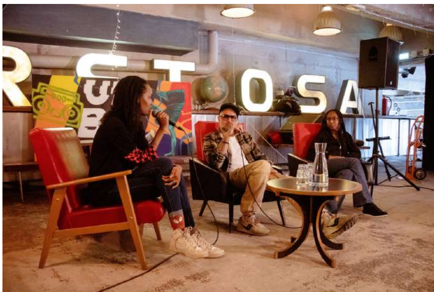
Moment d'échange entre nos parrains et intervenants pour l'URBN Talk autour du sujet Hip-hop et culture.

Cet échange fera l'objet d'une diffusion sur Youtube.