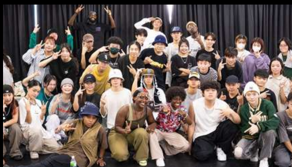
Ateliers de danse à l'Université d'Arts de Keelung (échange avec étudiants taiwanais)