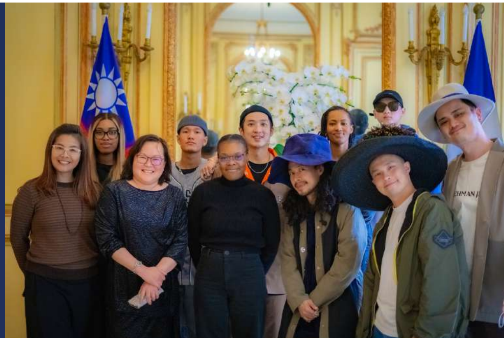
L'équipe URBN X College High au Centre culturel de Taiwan à Paris

Depuis 2022, l'association conçoit, organise et pilote le festival URBN. Au rayonnement international, ce festival 100% gratuit, au public majoritairement étudiant, a été pensé et conçu sur mesure en réponse aux attentes d'étudiants multi-potentiels avides d'opportunités.