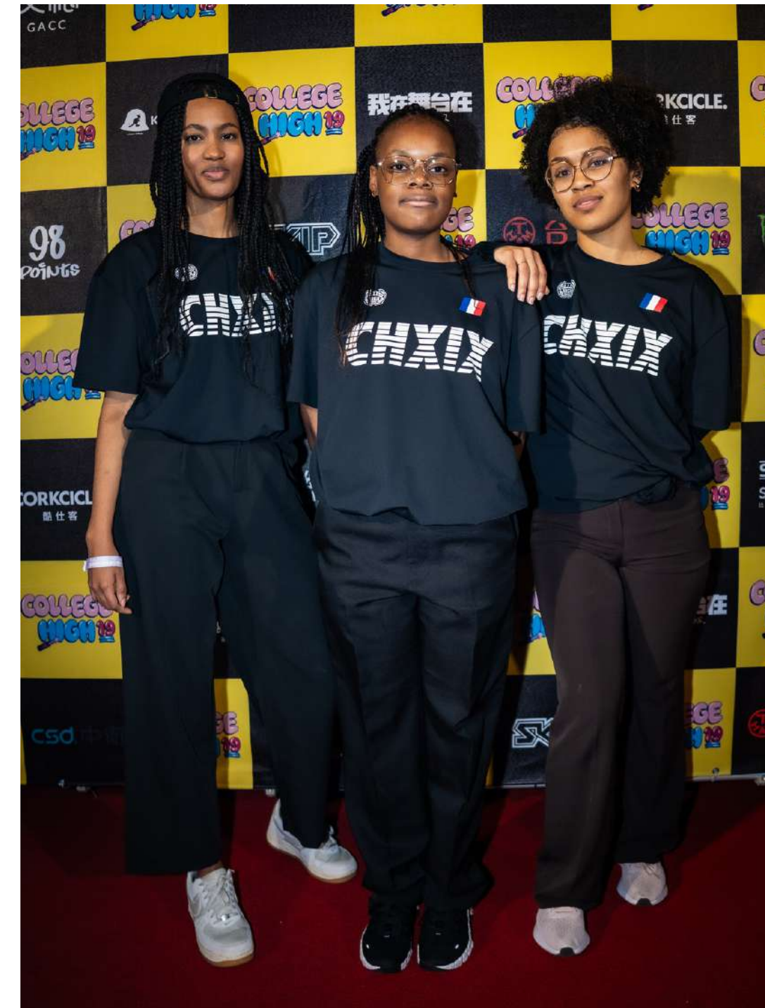
Les co-fondatrices d'Alternative Culture lors de la compétition internationale COLLEGE HIGH à Taipei, Taiwan.