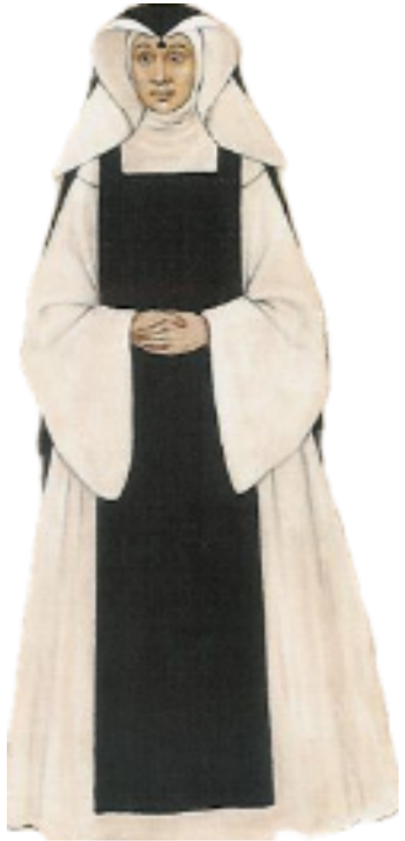
Tenue de religieuse