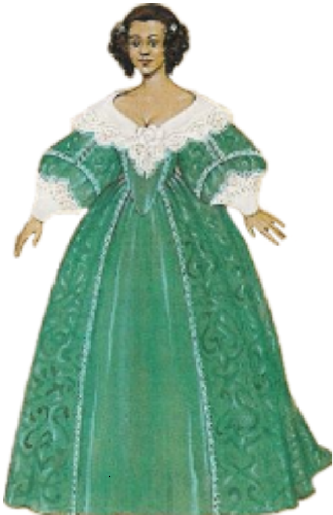
Robe de précieuse