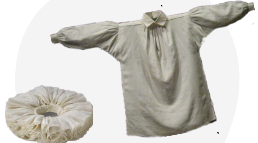
Chemise + col, fraise