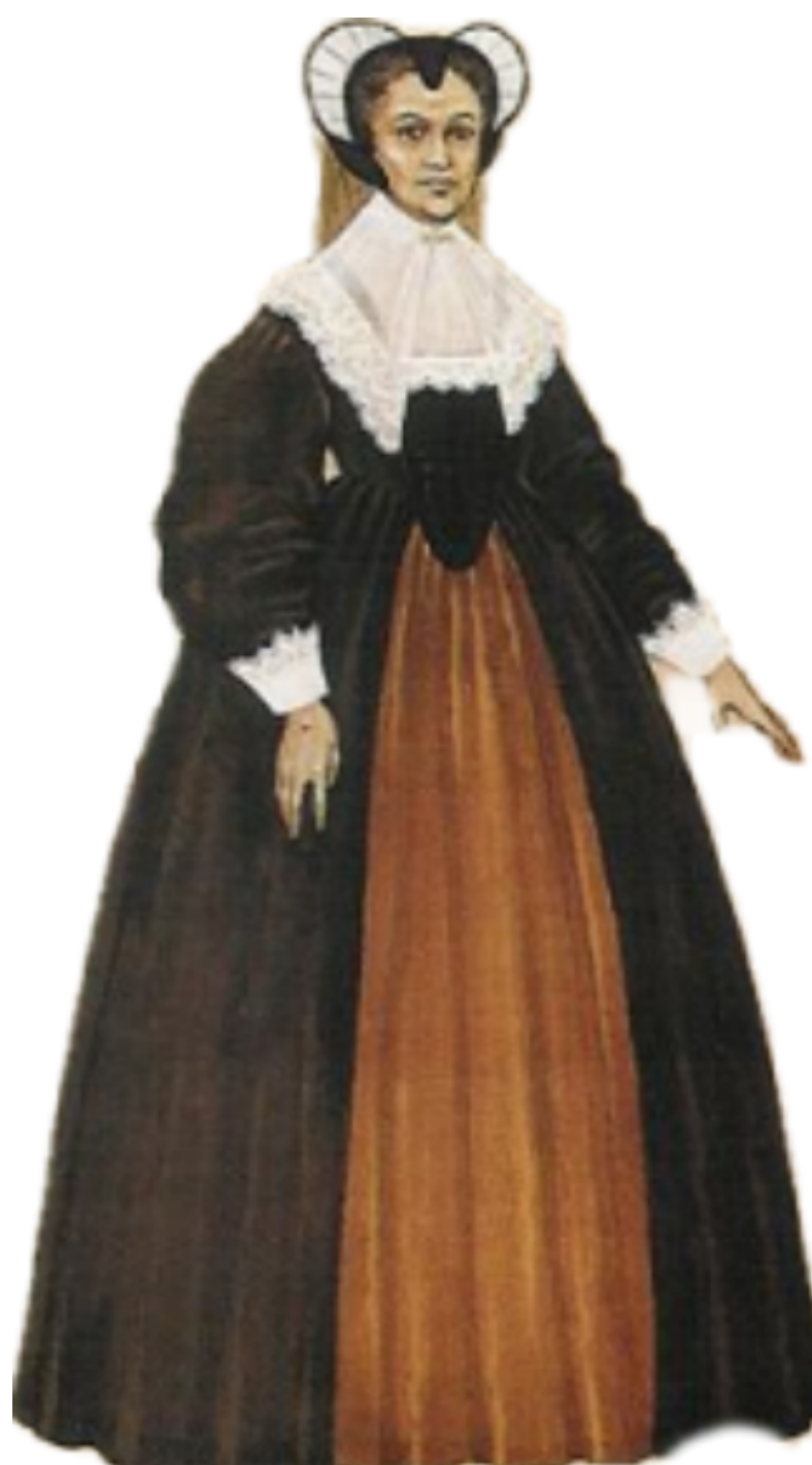
Robe plus modeste