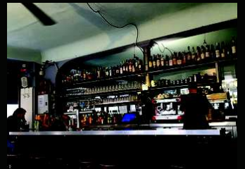
Pour le comptoir La Station, Montreuil La Cave Café 134, 18ème arrondissement