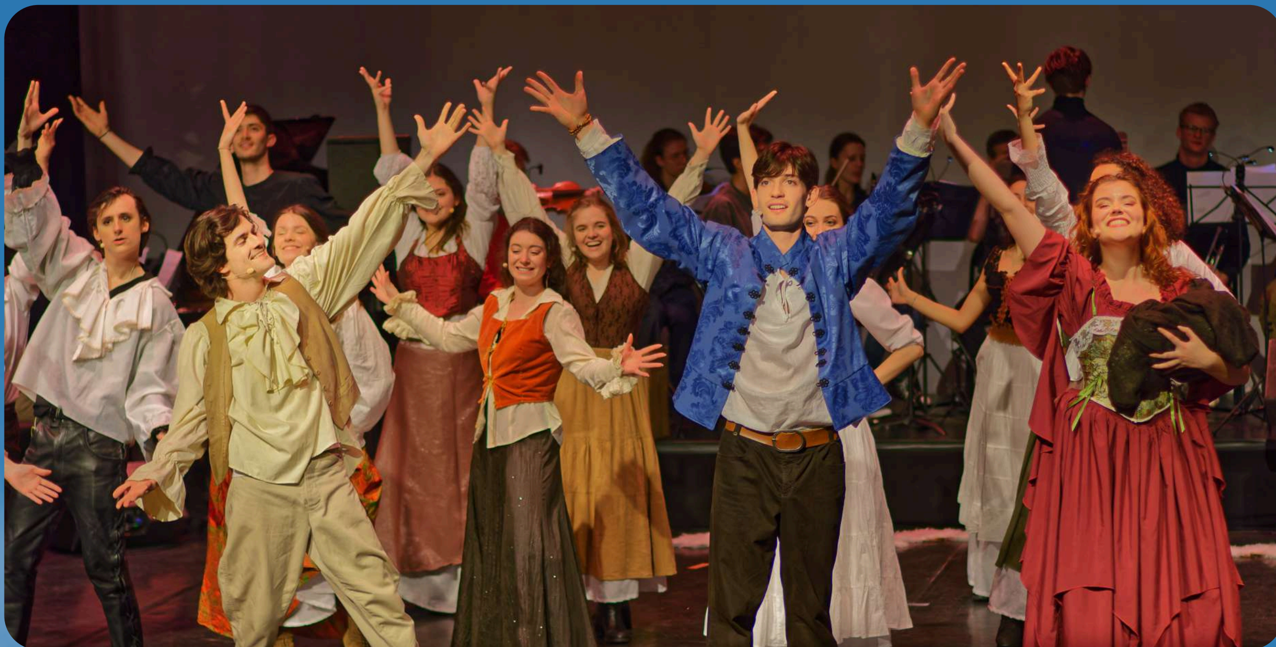
Something Rotten (2023-2024)