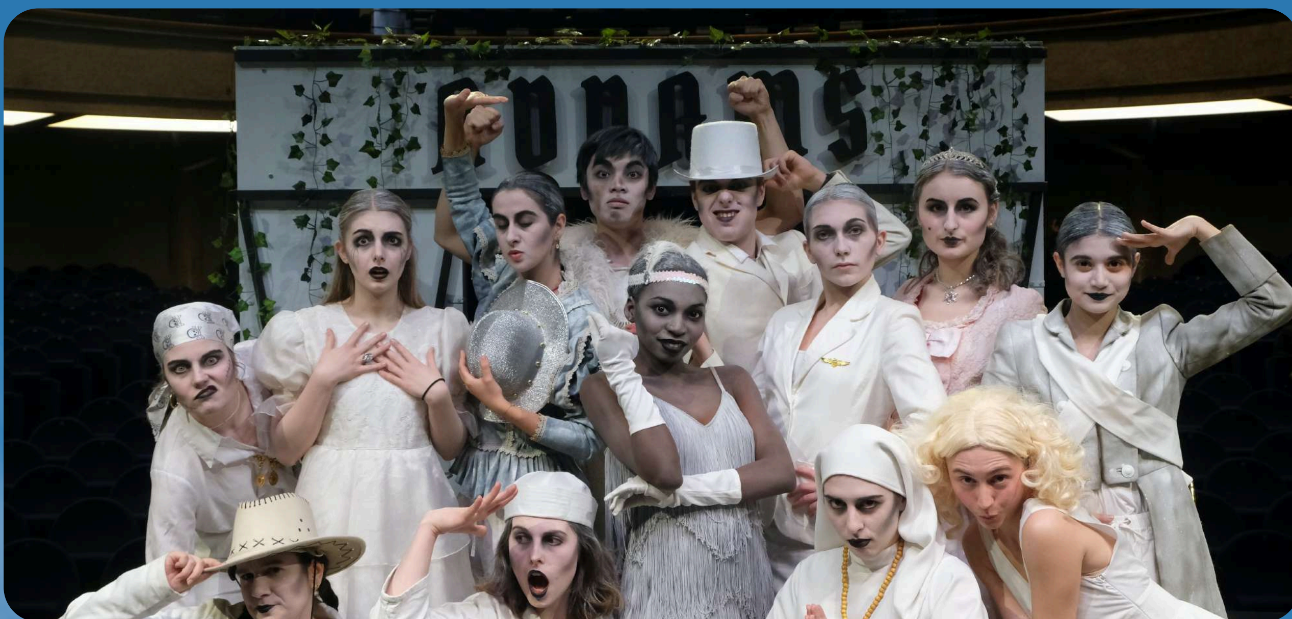
The Addams Family (2022-2023)