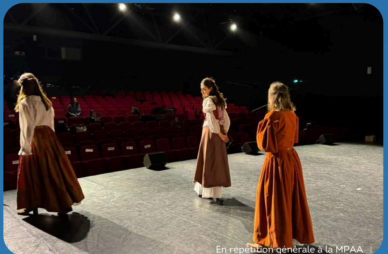
En répétition générale à la MPAA