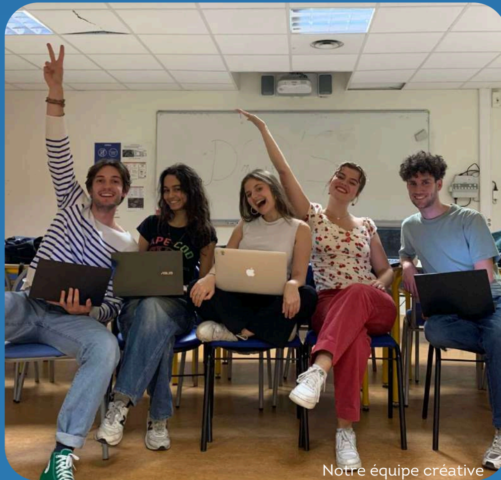
Notre équipe créative