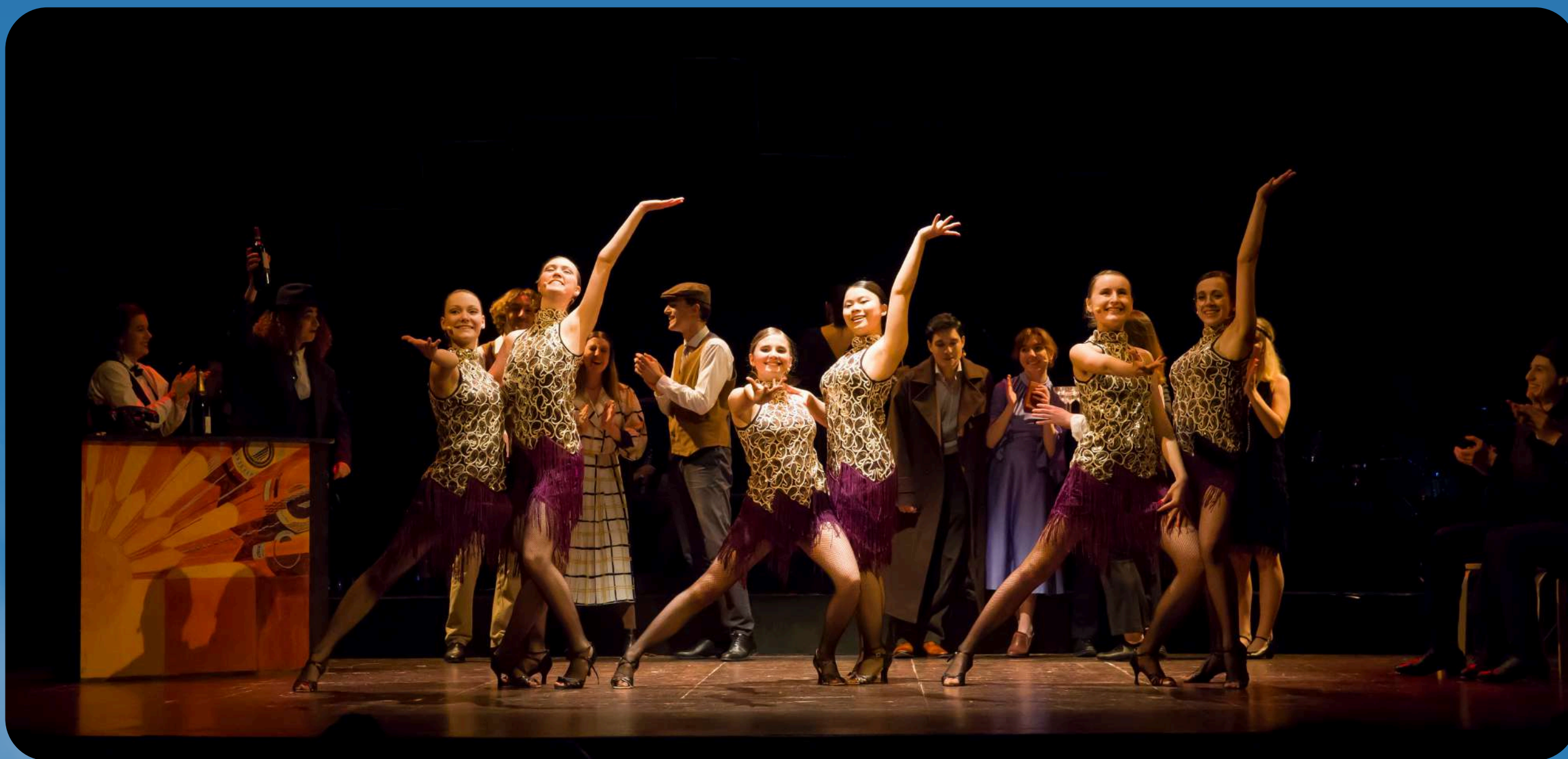
Bullets over Broadway (2021-2022)