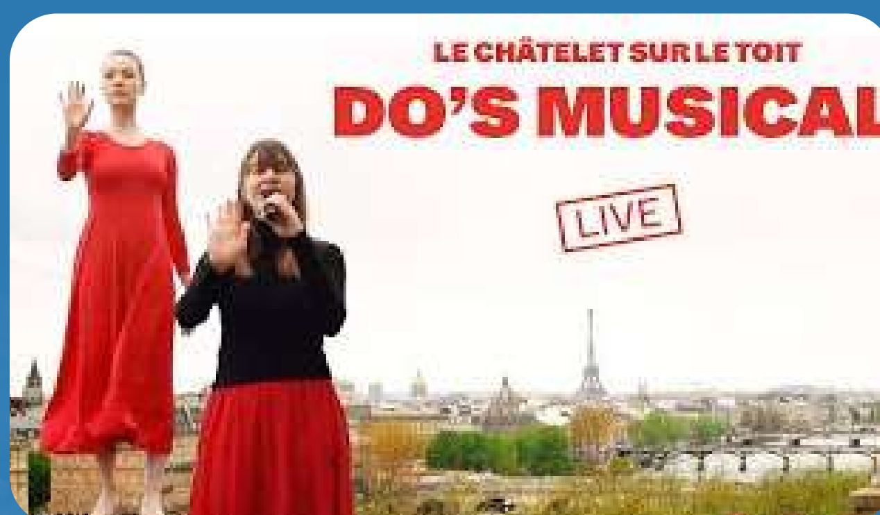
Châtelet sur le toit - Théâtre du Châtelet

Ainsi, notre ambition toujours renouvelée nous a permis de nous développer et de nous faire connaître du milieu étudiant (au-delà même du public de PSL) ainsi que du milieu du spectacle vivant . En effet, nous avons été invités par la Ville de Paris à jouer sur scène en Octobre 2023 et nous avons eu l'opportunité de participer au programme Châtelet sur le toit, du théâtre du Chatelet, en 2022.