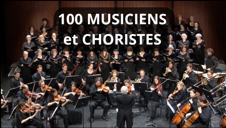
100 MUSICIENS et CHORISTES

Cette année, nous voyons les choses encore plus grand.