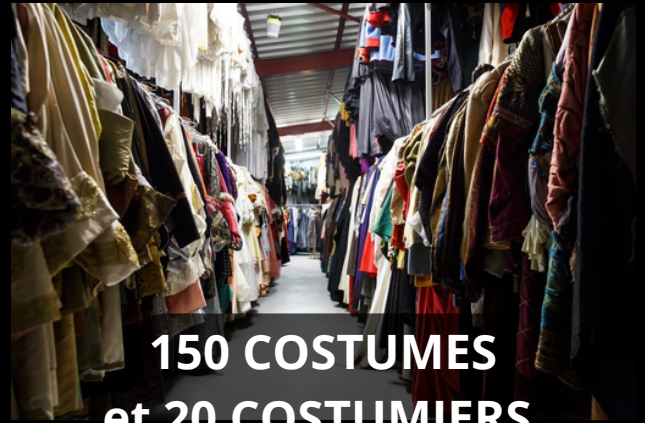
150 COSTUMES et 20 COSTUMIERS

FORMAT DU SPECTACLE : Un spectacle vivant racontant une histoire à travers des misés en scène spectaculaires , des jeux de lumière , du théâtre , des combats d'armes et chorégraphies de la danse et de la musique jouée en direct par un chœur et un orchestre, afin de créer une oeuvre d'art totale.