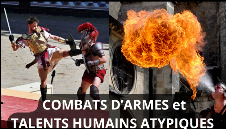
COMBATS D'ARMES et TALENTS HUMAINS ATYPIQUES