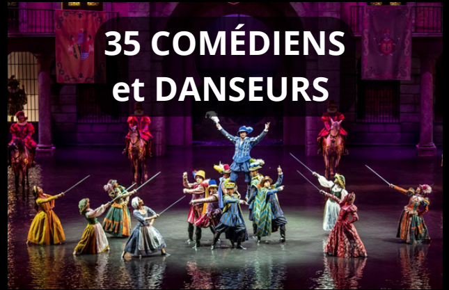
35 COMÉDIENS et DANSEURS