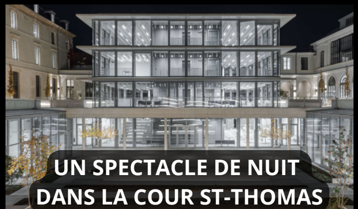
UN SPECTACLE DE NUIT DANS LA COUR ST-THOMAS du nouveau campus