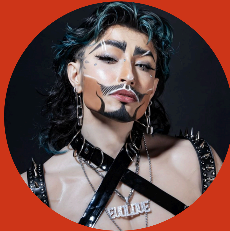
Levo Evolove Instagram