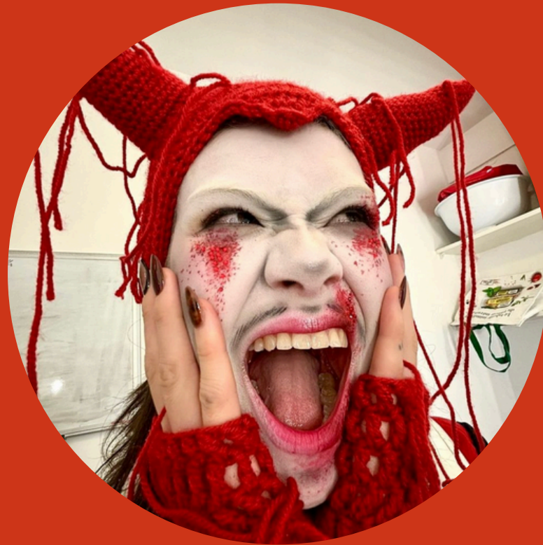
Charlie d'Emilio Instagram