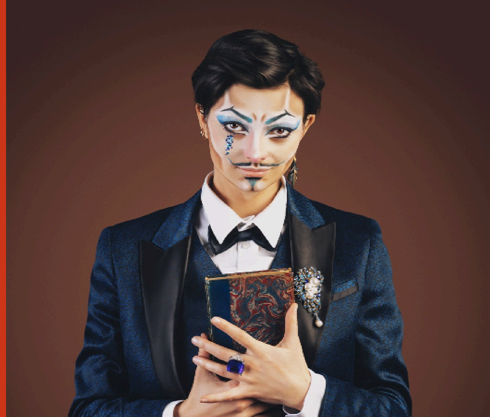
— Armand Songe, personnage principal de Roméo et Julio

En parallèle, nous bénéficions de leur part d'une aide organisationnelle et financière.