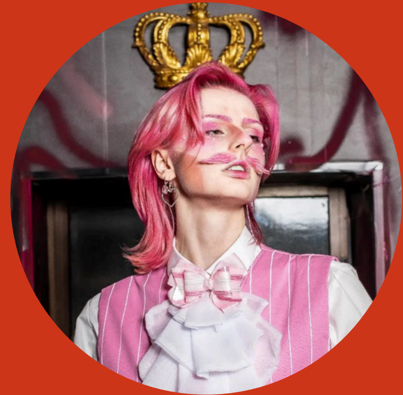
Canddy Evolove Instagram