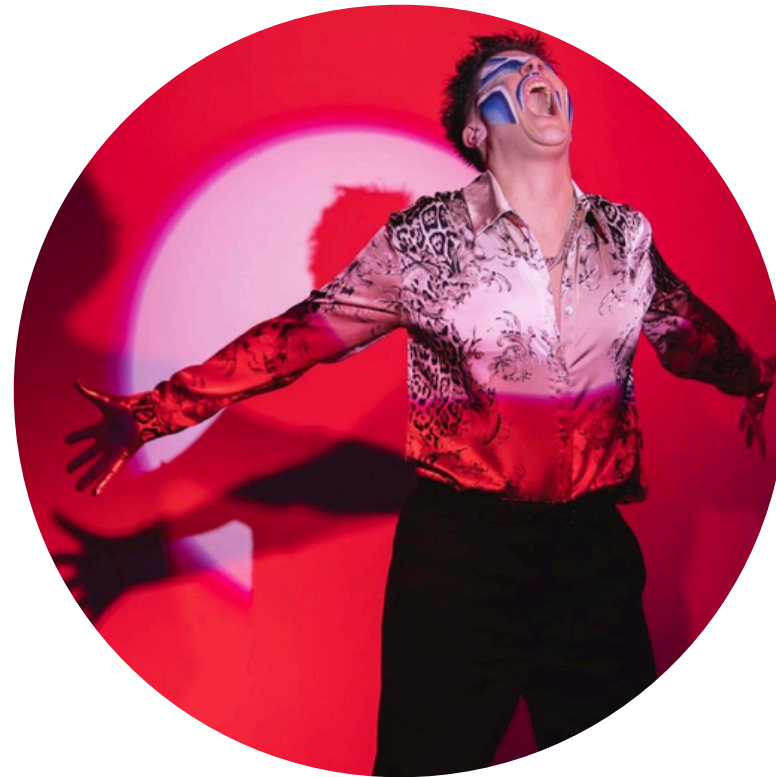
Al Pagay Instagram