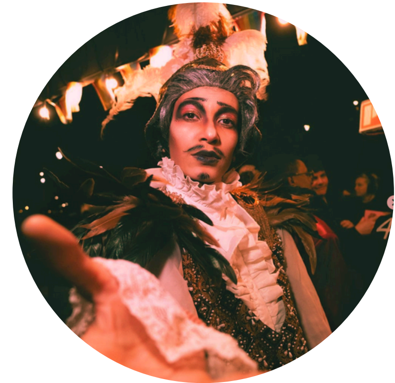
Baron P-Cock Instagram