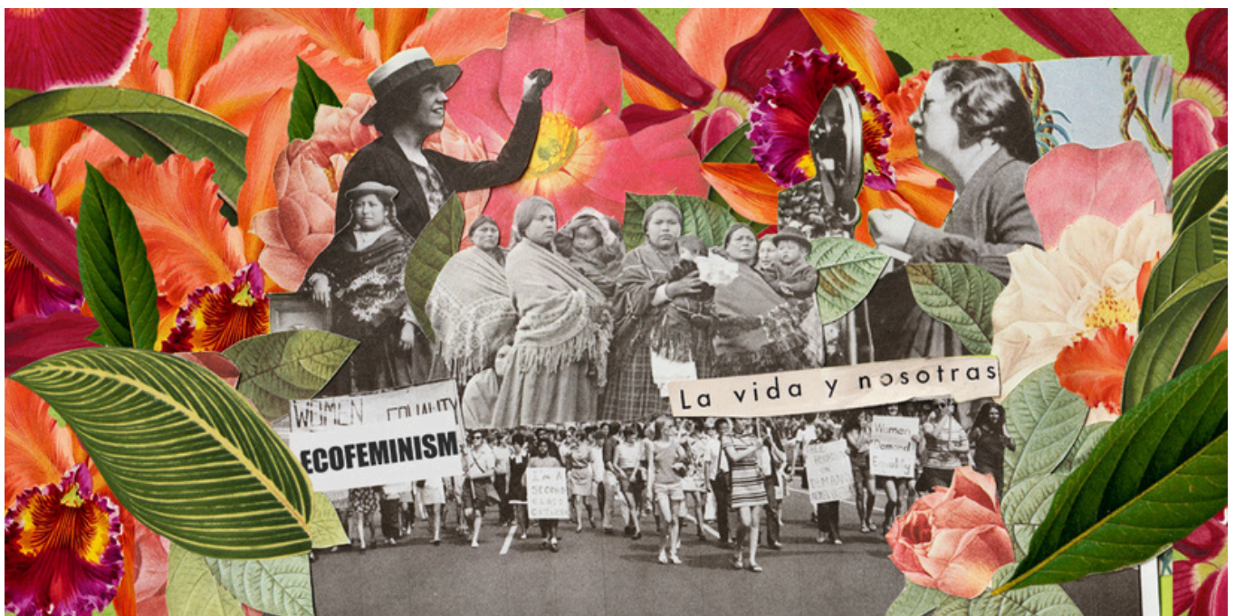
Illustration : Hansel Obando

Le festival ambitionne ainsi de proposer de nouvelles narrations plus inclusives, horizontales et sensibles aux voix marginalisées, tout en offrant un espace de résonance pour des alternatives créatives et solidaires face aux crises contemporaines.