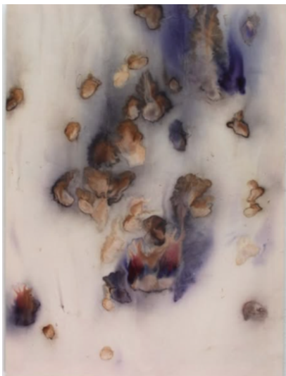
Clémence Vazard, RUMBÌA, 2024