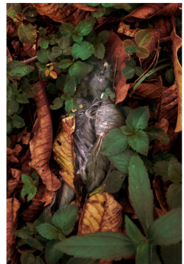
Isadora Romero, Série Ra'yi, 2018