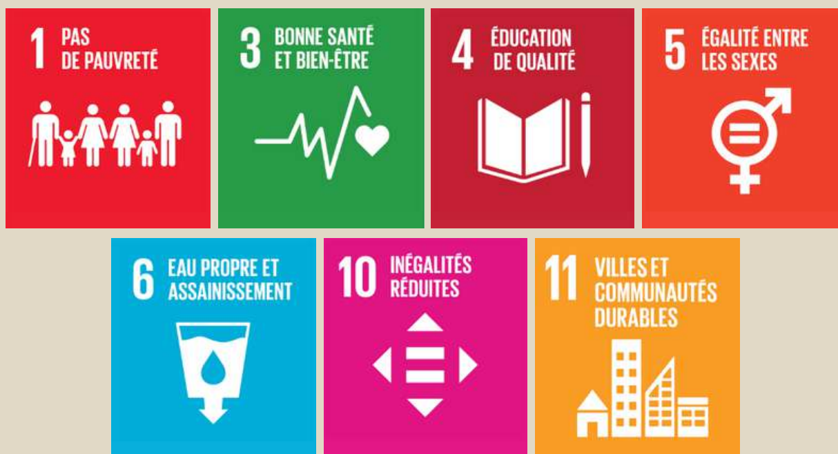
Objectifs de Développement Durable fixés par l'ONU en 2015.

En répondant aux besoins éducatifs pressants de la communauté de Rapcha-Basa, notre initiative s'aligne sur plusieurs Objectifs de Développement Durable (ODD) de l'ONU. Les principaux impacts du projet incluent une amélioration durable et digne du quotidien des 3500 habitants de Rapcha-Basa, tout en préservant l'environnement qui les entoure. En offrant une infrastructure éducative solide, nous participons activement à la santé et au bien être de la population ainsi qu'à l'assurance d'une éducation de qualité pour tous.