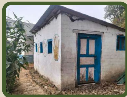
Sanitaire de l'école Chandrodaya

Enfin, les espaces extérieurs, pourtant essentiels au bon développement des enfants , sont souvent inexistantes ou insuffisantes. Cela limite ainsi les possibilités pour les élèves de profiter pleinement des moments de détente et de pratiquer des activités physiques en toute sécurité.