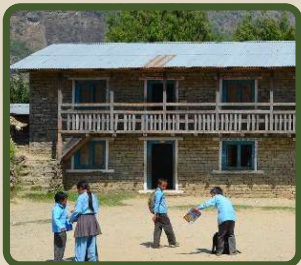
Elèves devant Shree Chandrodaya