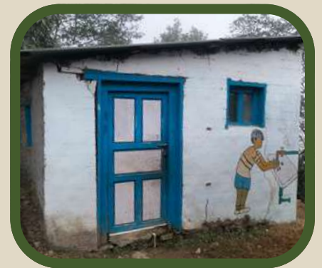
Sanitaire de l'école Chandrodaya (vu de derrière)