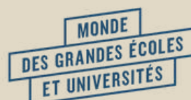
MONDE DES GRANDES ÉCOLES