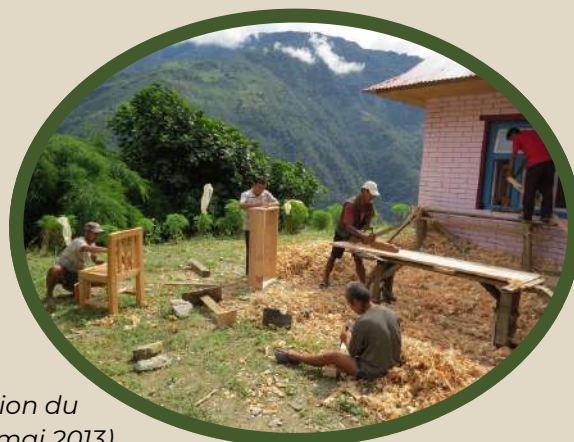
Construction du dispensaire (mai 2013).

Rapcha-Basa, situé dans une région montagneuse où l'accès aux infrastructures modernes est limité, bénéficie depuis 2013 d'un dispensaire construit par l'association ANUVAM . Cet établissement offre des consultations et des soins médicaux gratuits , ce qui en fait un pilier essentiel pour la santé des habitants.