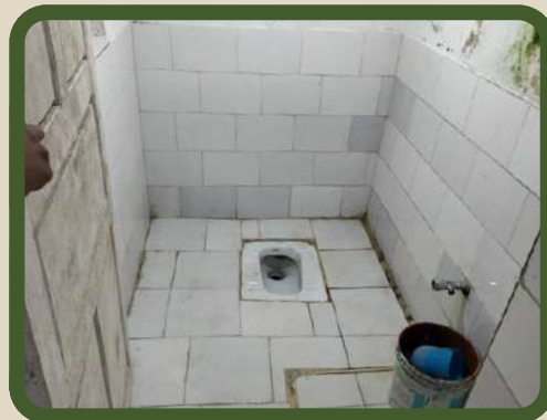
Seules latrines de l'école