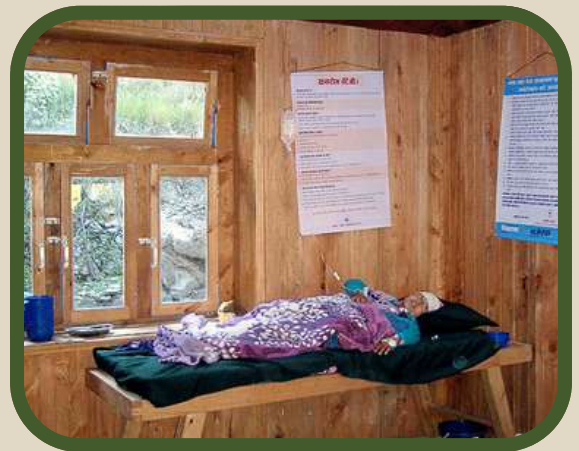
Salle de consultation du dispensaire.