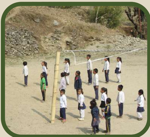
Elèves de l'école Janakalyan

Une réhabilitation des sols est essentielle pour offrir aux enfants un cadre propice à leur développement et à leur réussite scolaire .