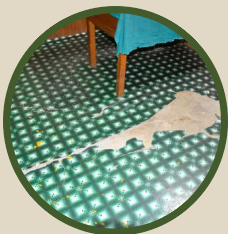
Revêtement au sol du dispensaire.

Ce dernier est particulièrement touché par des problèmes d'approvisionnement en eau . Bien que de l'eau soit acheminée au dispensaire depuis une rivière surplombant le hameau, ce système est vulnérable aux interruptions car la rivière n'est pas alimentée toute l'année. En cas de défaillance de l'approvisionnement ou de la conduite d'alimentation, le dispensaire se retrouve sans eau jusqu'à ce que le problème soit résolu.