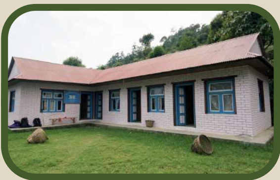
Dispensaire vu de l'extérieur.