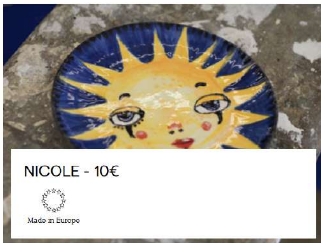
NICOLE - 10€