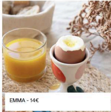
EMMA - 14€