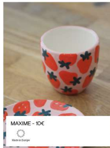
MAXIME - 10€