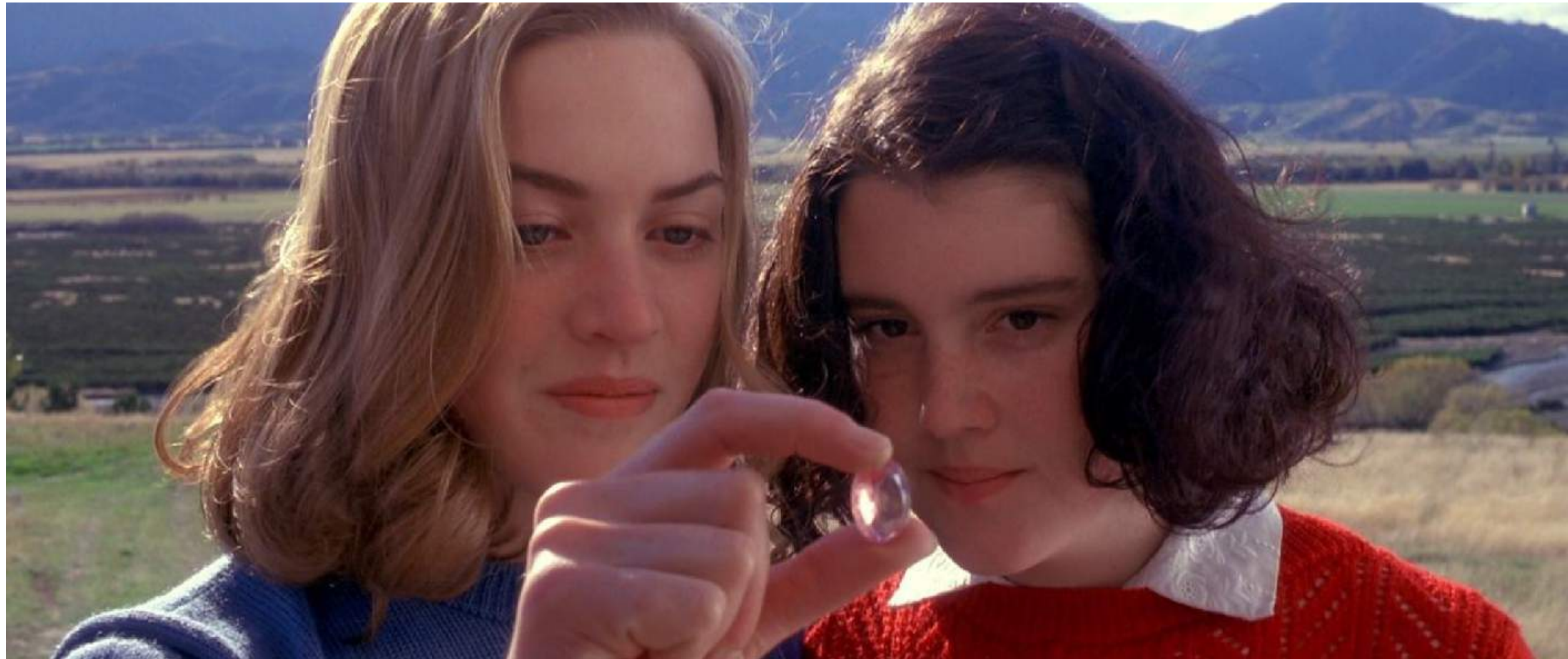
Heavenly Creatures réalisé par Peter Jackson (1994)

Emmy, une jeune fille de 17 ans habituée à la solitude, rencontre une extraterrestre qui lui annonce qu'elle a été choisie pour la rejoindre sur sa planète. Emmy, séduite par la promesse d'un nouveau départ, doit cependant trouver quelqu'un avec qui partir.