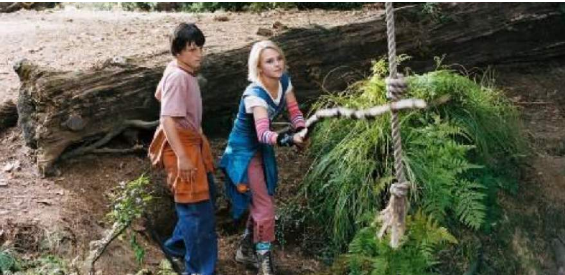
The Secret of Terabithia réalisé par Gábor Csupó (2007)