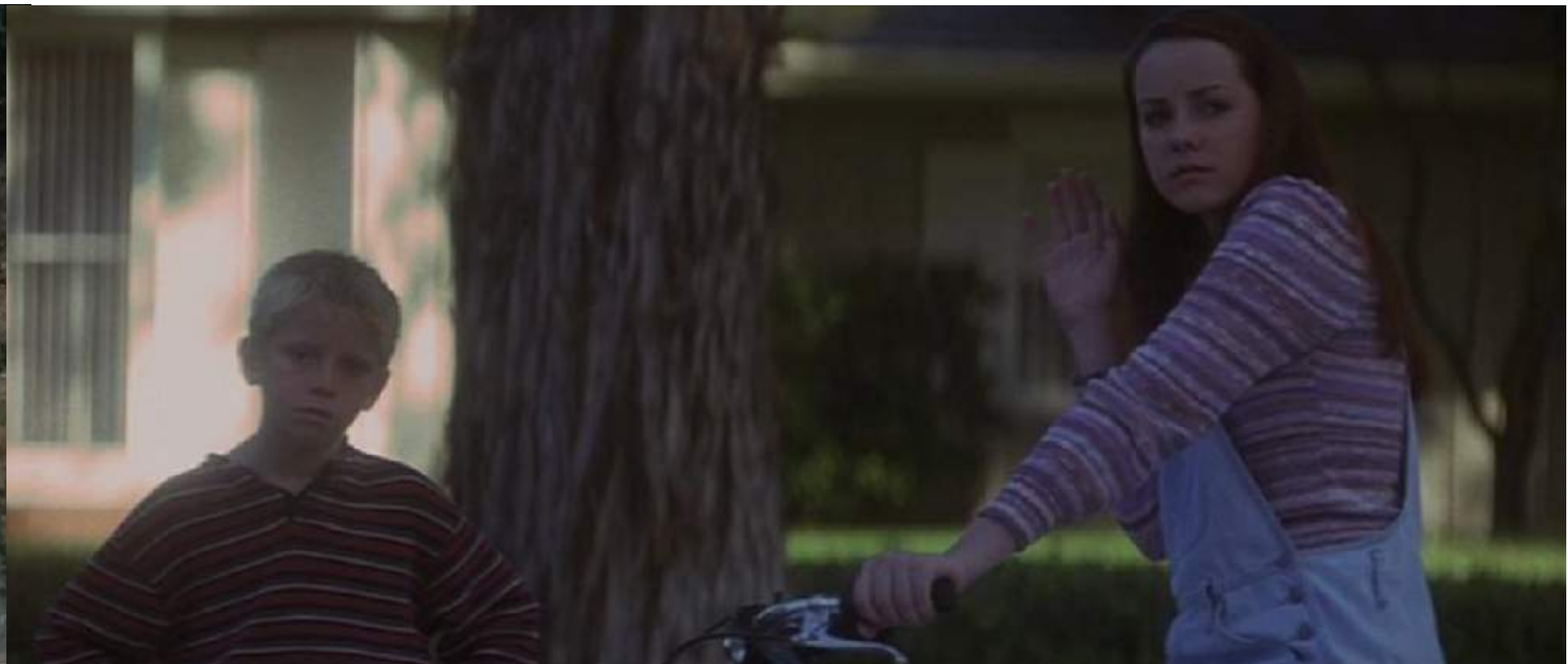
Donnie Darko réalisé par Richard Kelly (2001)