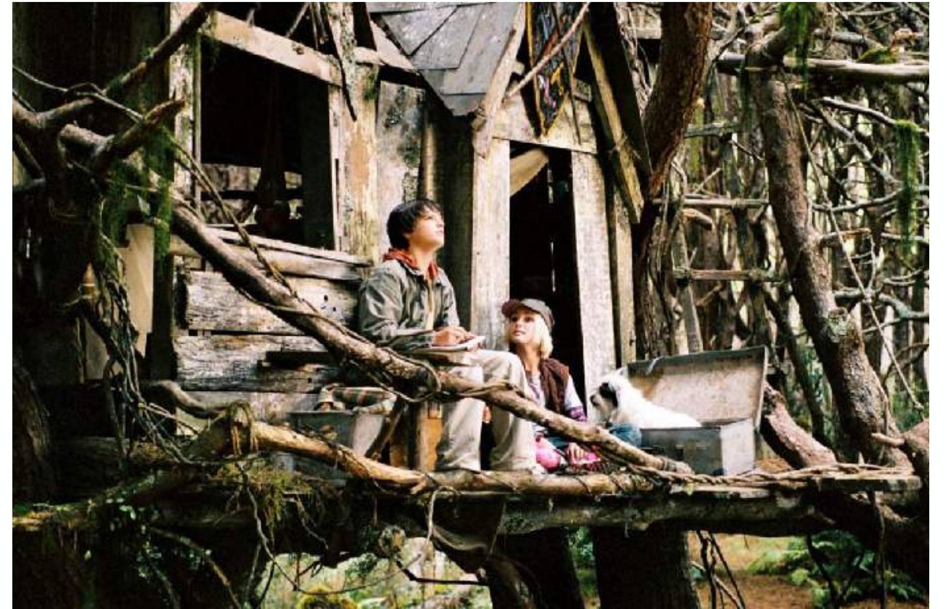
The Secret of Terabithia réalisé par Gábor Csupó (2007)