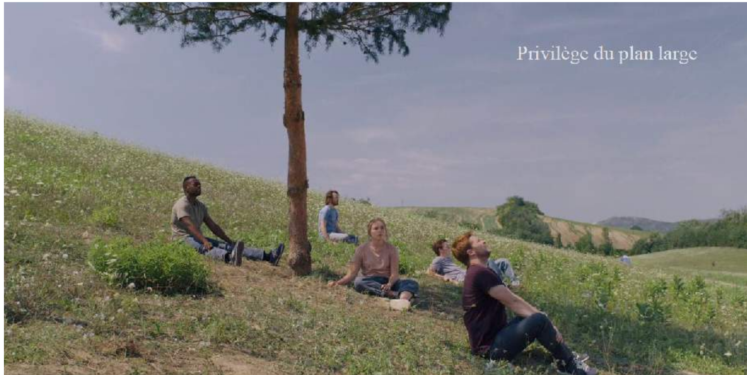
Midsommar réalisé par Ari Aster (2019)