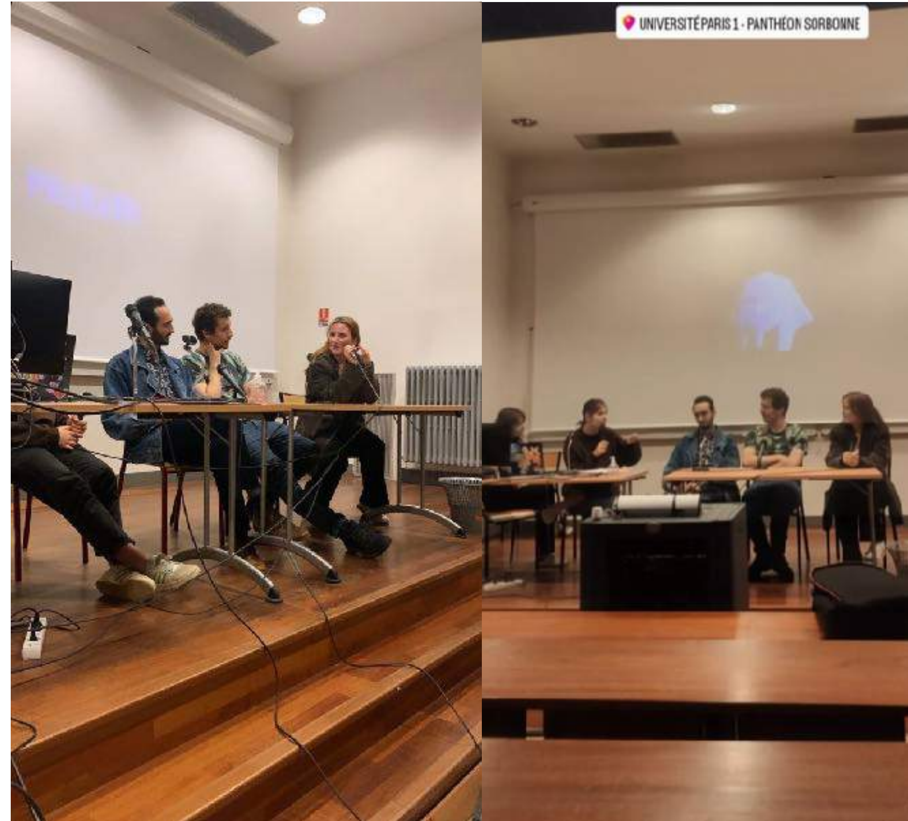
Projections dans les universités de Paris