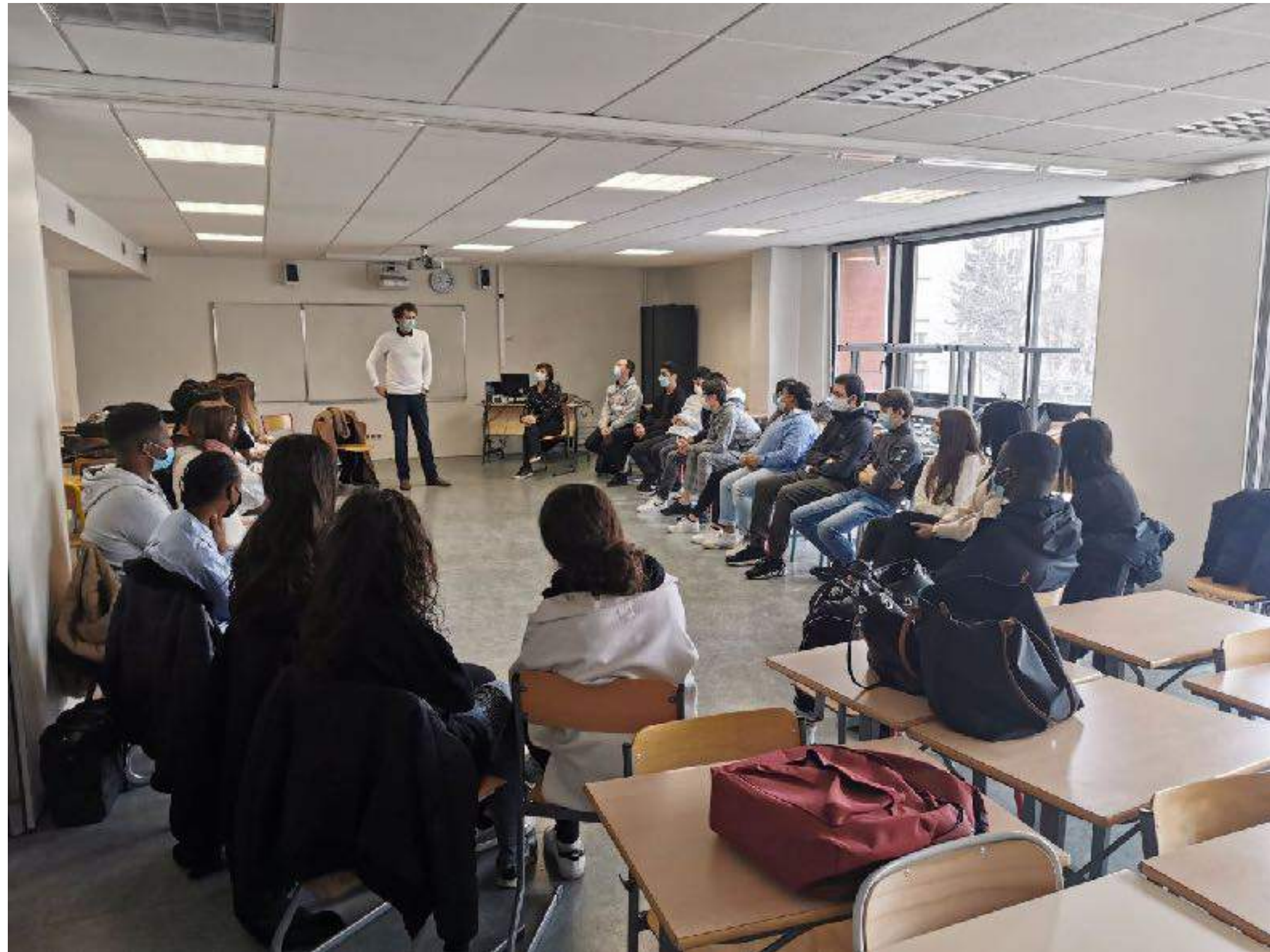
Ateliers cinéma au Lycée Lucie Aubrac à Pantin