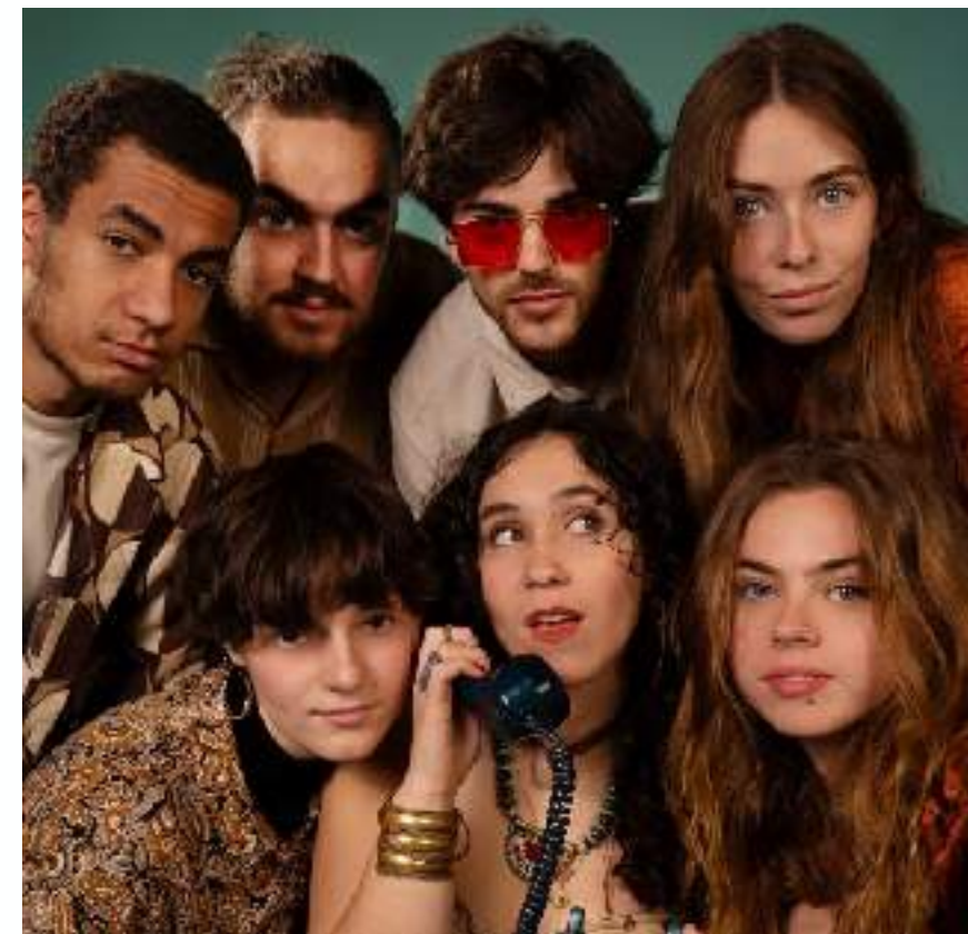
Lauréat Créart'UP 2025-2026 avec son groupe Nodz

Nous serons aussi propulsé vers l'émerveillement, grâce à un dernier thème logiquement lié à la dimension surnaturelle et merveilleuse du récit. Un petit Chœur et une douce voix soliste auront une place première, rappelant la dimension profondément humaine qui s'affirme au fur et à mesure du film (la voix d'Emmy).