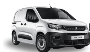
Peugeot e-Partner ou equivalent Camionnette 4m3

📍 Ucar Relais Paris Mairie 18 1 PLACE JULES JOFFRIN 75018 Paris