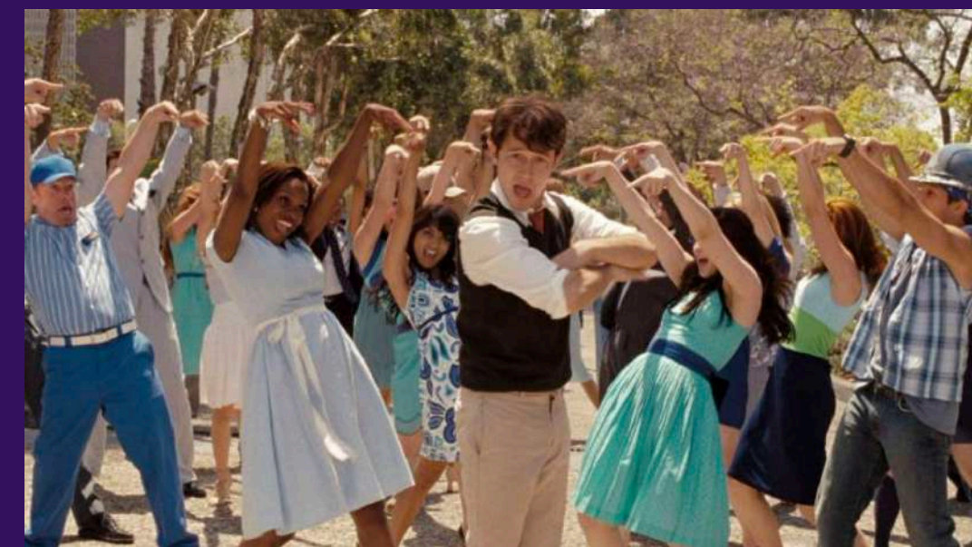
500 JOURS ENSEMBLE - MARC WEBB