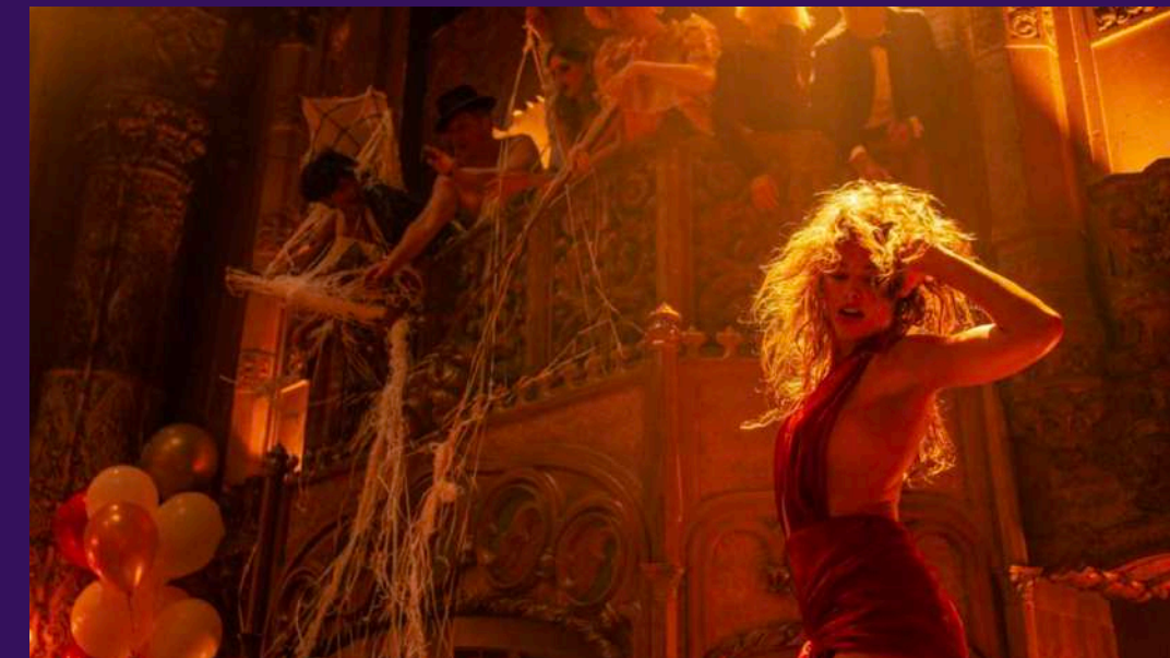
BABYLONE - DAMIEN CHAZELLE

Le film dialogue avec l'héritage de la comédie musicale, où cinéma, danse et musique s'entrelacent pour faire du mouvement un langage narratif à part entière. Des œuvres comme La La Land, 500 jours ensemble ou Black Swan ont nourri la réflexion de la réalisatrice sur la manière dont la danse peut surgir dans un récit réaliste pour exprimer l'émotion et interroger le rapport au corps. Des influences plus contemporaines, issues du clip, ont également guidé son approche du mouvement dans l'espace et d'une caméra pensée pour accompagner la danse.